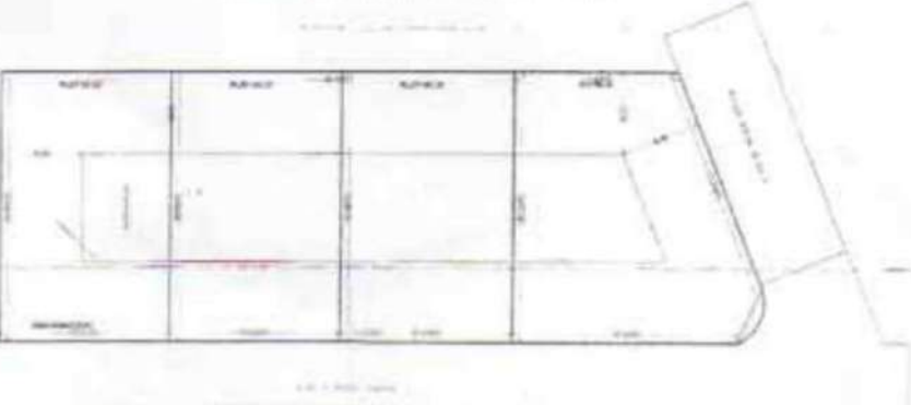
PLOT BEFORE AMALGAMATION (Scale - 1:200)