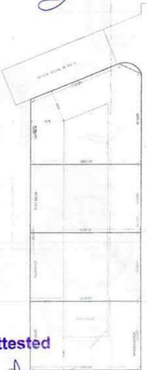
PLOT BEFORE AMALGAMATION (Scale - 1:200)