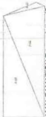
AMALGAMATION Triangulation (Scale - 1:500)