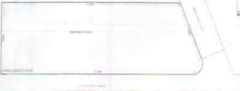
PLOT AFTER AMALGAMATION (Scale - 1:200)