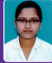
क.समानता जनवधू RGNM 2015 Batch