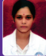
क. राजकन्या मडकराम RANM 2013 Batch