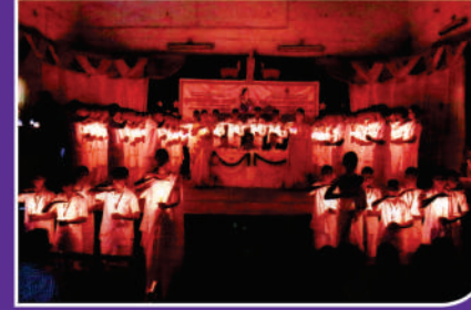
दिप प्रज्वलन व शपथविधी

विशेष बाब म्हणजे आत्महत्याप्रस्त शेतकरी कुटुंबातील जी.एन.एम. व ए.एन.एम.च्या कोर्स करीता प्रत्येकी १ विद्यार्थीनीसाठी राखीव जागा ठेवण्यात येवून प्रशिक्षण निशुल्क केलेले आहे.