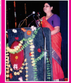
प्राचार्या यांचे भाषण