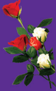
क. राणी बोरडे