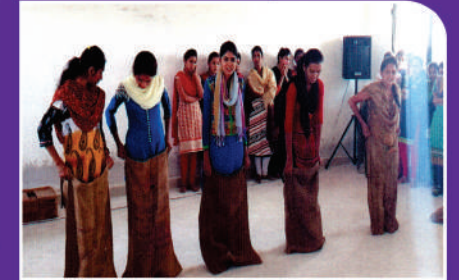
१२ मे कार्यक्रम