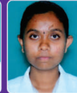
क.प्रणाली वडवण RANM 2018 Batch