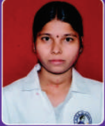
क. राणी इनडनवार RANM Aug. 2011 Special Batch