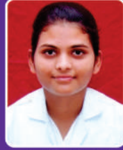
क. अभिनी वरते RGNM 2014 Batch